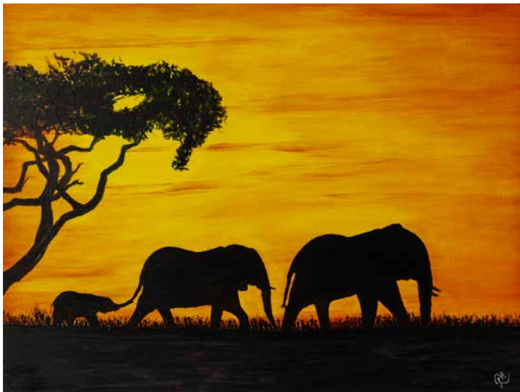
Silhouetten van olifanten