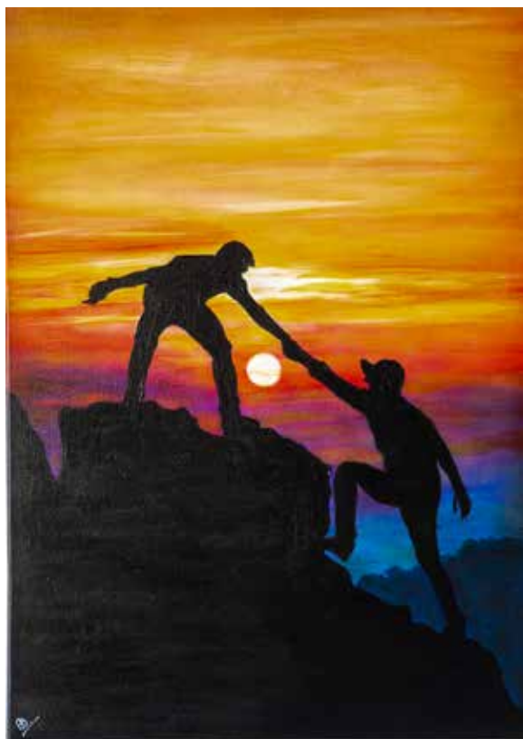
Silhouetten van twee bergbeklimmers